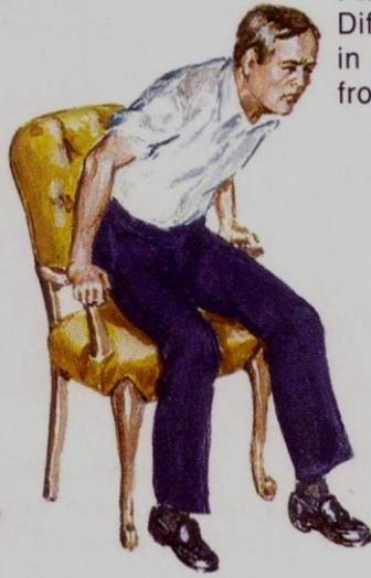
Phase 2 Difficulty in arising from chair