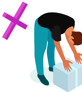
Cara yang Salah