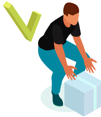
Cara yang Benar